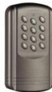
WEWNĘTRZNY PROMI ECO