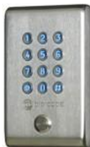
ZEWNETRZNY KCIN / KCIEN